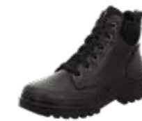
1-000609-0000 SCHWARZ, NAPPA/TEXTIL

Upper: siehe oben Futter: GORE-TEX® Soft Liefertermin: ab sofort WMS mittel