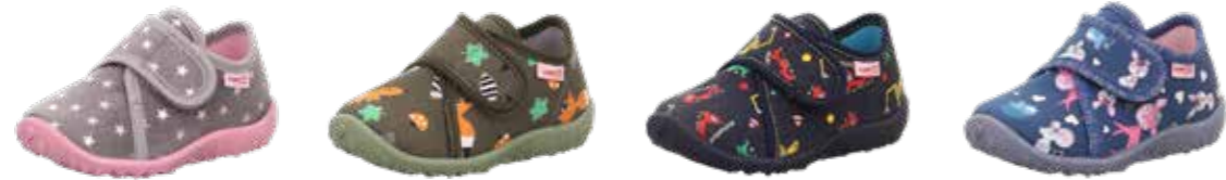
1-009246-2100 GRAU 1-009246-7020 GRÜN/MEHRFARBIG 1-009246-8130 BLAU/MEHRFARBIG 1-009246-8140 HELLBLAU/MEHRFARBIG

Upper: TEXTIL Futter: Textilfutter Sohle: Synthetik Größe: 18-26 Liefertermin: ab Mitte August WMS mittel