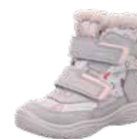
1-009091-2500 HELLGRAU, 25-30

Upper: SYNTHETIK/TEXTIL/EFFEKTLERDER Futter: GORE-TEX® Koala