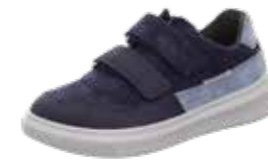
1-006456-8010 BLAU, VELOUR/NUBUK/TEXTIL