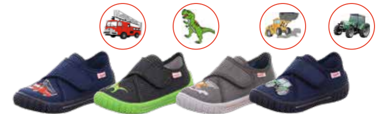
0-800278-8000 BLAU/ROT 1-800278-0010 SCHWARZ 1-800278-2050 GRAU/ORANGE 0-808278-8000 OCEAN

Upper: TEXTIL Futter: Textilfutter Sohle: Synthetik Größe: 23-38 Liefertermin: ab sofort WMS mittel