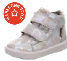
1-000778-2500 HELLGRAU, EFFEKTLER/TEXTIL

Upper: SYNTHETIK/TEXTIL | Sohle: PU/TPU Futter: GORE-TEX® Soft | Größe: 20-28 Liefertermin: ab sofort | WMS mittel