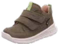
1-000369-7000 GRÜN, 20-28

Upper: NUBUK/VELOUR Futter: GORE-TEX® Prism 3ly Liefertermin: ab sofort