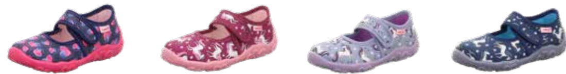
0-800283-8800 BLAU/PINK 1-800283-5010 ROT/MEHRFARBIG 1-800283-8080 BLAU/MEHRFARBIG 1-800283-8110 BLAU/MEHRFARBIG

Upper: TEXTIL Futter: Textilfutter Sohle: Synthetik Größe: 23-38 Liefertermin: ab Anfang August WMS mittel