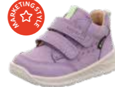
1-000369-8510 LILA/HELLGRÜN, 20-28