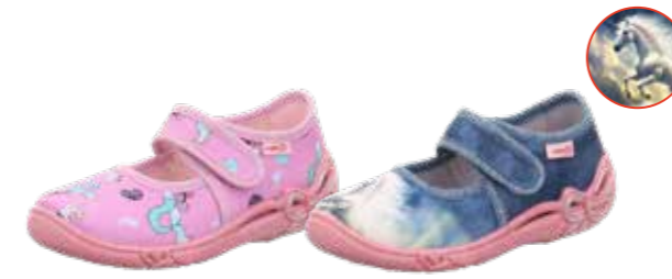
1-800288-5540 ROSA/MEHRFARBIG 1-800288-8050 BLAU/ROSA

Upper: TEXTIL Futter: Textilfutter Sohle: Synthetik Größe: 23-35 Liefertermin: ab Ende Juli WMS mittel