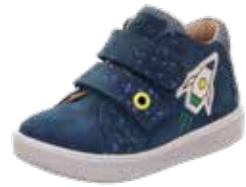
1-000772-8030 BLAU, VELOUR/EFFEKTLER/NUBPA/TEXTIL

Upper: siehe oben | Sohle: PU Futter: Lederfutter | Größe: 19-28 Liefertermin: ab Anfang August | WMS mittel