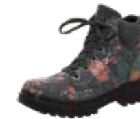
1-000609-4000 BEIGE, EFFEKTLER/TEXTIL

Sohle: PU Größe: 27-40 Liefertermin: ab sofort WMS mittel