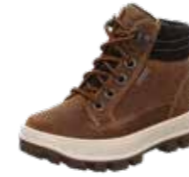
1-800473-3020 BRAUN, 34-43

Upper: VELOUR/TEXTIL Futter: GORE-TEX® Koala Liefertermin: ab sofort WMS weit