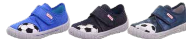
0-800273-8500 BLAU/WEISS 0-800273-8700 BLAU/WEISS 1-800273-8000 BLAU

Upper: TEXTIL Futter: Textilfutter Sohle: Synthetik Größe: 23-38 Liefertermin: ab sofort WMS mittel