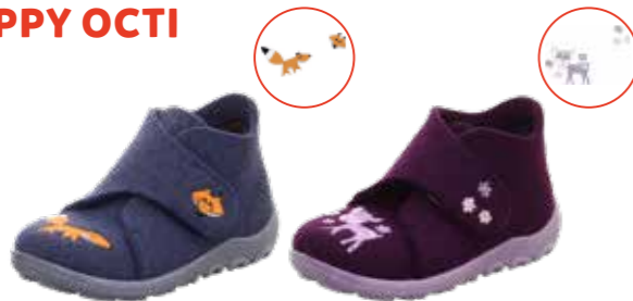
1-006291-8000 BLAU/ORANGE 1-006291-8500 LILA

Upper: WOLLFILZ Futter: Vlies Sohle: Synthetik Größe: 20-30 Liefertermin: ab Anfang September WMS mittel