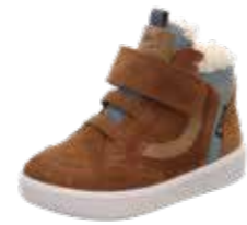
1-000779-3000 BRAUN/BLAU, VELOUR/TEXTIL

Upper: siehe oben | Sohle: PU Futter: GORE-TEX® Soft | Größe: 19-28 Liefertermin: ab sofort | WMS mittel