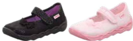
1-006271-0040 SCHWARZ 1-006271-5540 ROSA/WEISS

Upper: TEXTIL Futter: Textilfutter Sohle: Synthetik Größe: 23-38 Liefertermin: ab Anfang August WMS mittel