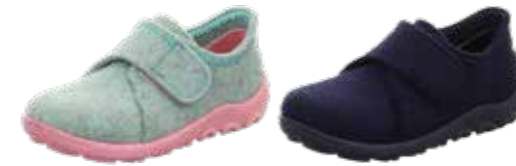
1-006296-7500 HELLGRÜN/ROSA 1-006296-8010 DUNKELBLAU

Upper: WOLLFILZ Futter: Vlies Sohle: Synthetik Größe: 20-35 Liefertermin: ab sofort WMS mittel