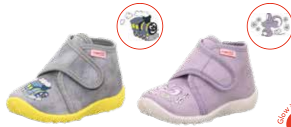
1-009253-2010 GRAU 1-009253-8520 LILA

Upper: TEXTIL Futter: Textilfutter Sohle: Synthetik Größe: 18-26 Liefertermin: ab Ende Juli WMS mittel