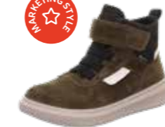
1-006454-7020 YERBA (GRÜN)

Upper: VELOUR/TEXTIL Futter: GORE-TEX® Soft