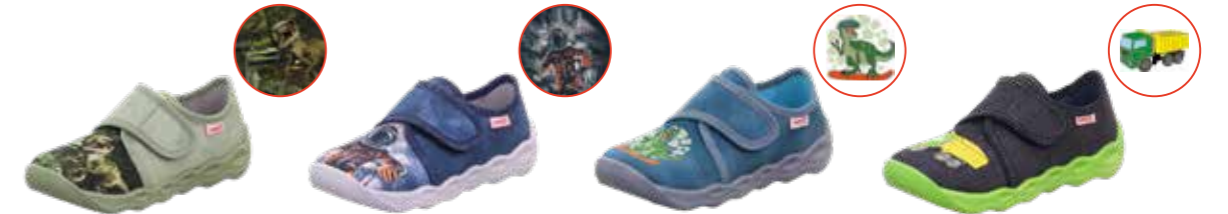
1-006274-7520 GRÜN 1-006274-8000 BLAU/MEHRFARBIG 1-006274-8020 BLAU 1-006274-8030 BLAU/GRÜN

Upper: TEXTIL Futter: Textilfutter Sohle: Synthetik Größe: 23-38 Liefertermin: ab Mitte August WMS mittel