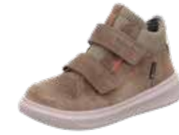
1-006469-7000 GRÜN, VELOUR/TEXTIL

Upper: siehe oben Futter: GORE-TEX® Soft