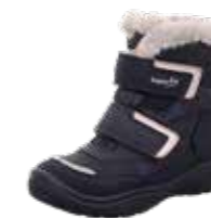
1-009091-8010 BLAU, 25-35