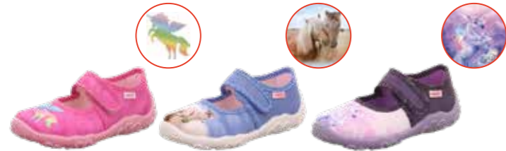
1-000281-5500 ROSA/MEHRFARBIG, 23-35 1-000281-8400 BLAU/MEHRFARBIG, 23-35 1-000281-8540 LILA, 23-35

Upper: TEXTIL Futter: Textilfutter Sohle: Synthetik Größe: siehe oben Liefertermin: ab Ende Juli WMS mittel