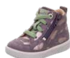
1-000773-8510 LILA/HELLGRÜN, EFFEKTLER/VELOUR/TEXTIL

Upper: siehe oben | Sohle: PU Futter: Lederfutter | Größe: 19-28 Liefertermin: ab Mitte August | WMS mittel