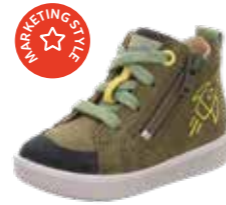
1-000773-7000 GRÜN/GRAU, VELOUR/TEXTIL