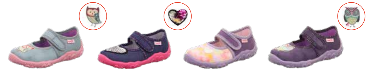
1-000280-7500 GRÜN 1-000280-8000 BLAU 1-000280-8500 LILA 1-000280-8510 LILA

Upper: WOLLFILZ Futter: Vlies Sohle: Synthetik Größe: 20-30 Liefertermin: ab Mitte August WMS mittel