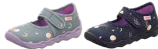
1-006272-7520 HELLGRÜN/MEHRFARBIG, 23-38 1-006272-8030 BLAU/MEHRFARBIG, 23-36

Upper: TEXTIL Futter: Textilfutter Sohle: Synthetik Größe: siehe oben Liefertermin: ab sofort WMS mittel