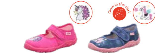
0-800282-6300 PINK/LILA 1-800282-8070 BLAU/PINK

Upper: TEXTIL Futter: Textilfutter Sohle: Synthetik Größe: 23-35 Liefertermin: ab sofort WMS mittel