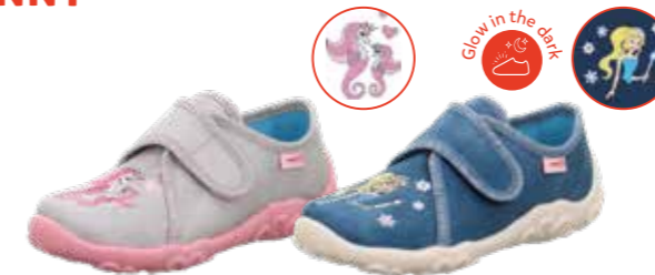
1-000258-2500 GRAU/ROSA 1-000258-8060 TÜRKIS

Upper: TEXTIL Futter: Textilfutter Sohle: Synthetik Größe: 23-35 Liefertermin: ab sofort WMS mittel