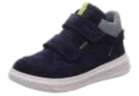
1-006469-8010 BLAU/HELLGRÜN, VELOUR/ NAPPA/TEXTIL