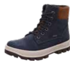
0-800474-9400 NIAGARA KOMBI

Sohle: PU/TPU Größe: 31-43 Liefertermin: ab Anfang Oktober WMS weit