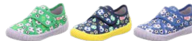
1-000279-7030 GRÜN 1-000279-8070 BLAU/MEHRFARBIG 1-000279-8400 BLAU/MEHRFARBIG

Upper: TEXTIL Futter: Textilfutter Sohle: Synthetik Größe: 23-38 Liefertermin: ab Mitte August WMS mittel