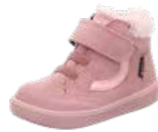
1-000779-5500 ROSA, VELOUR/EFFEKTLER/TEXTIL

Upper: siehe oben | Sohle: PU Futter: GORE-TEX® Soft | Größe: 19-28 Liefertermin: ab sofort | WMS mittel