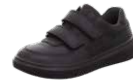
1-006456-0000 SCHWARZ, NAPPA/TEXTIL