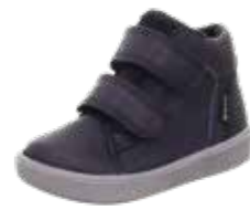
1-000778-8000 BLAU, NAPPA/TEXTIL

Upper: siehe oben | Sohle: PU Futter: GORE-TEX® Soft | Größe: 19-28 Liefertermin: ab Mitte August | WMS mittel