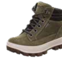
1-800473-7010 GRÜN, 25-43

Upper: VELOUR/TEXTIL Futter: GORE-TEX® Koala Liefertermin: ab sofort WMS weit