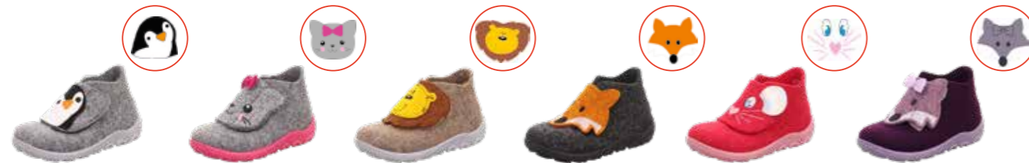
1-006295-2000 GRAU/SCHWARZ 1-006295-2500 HELLGRAU/PINK 1-006295-4000 BEIGE/GRAU 1-006295-4700 GRAU/ORANGE 1-006295-5510 PINK/ROSA 1-006295-8510 LILA

Upper: WOLLFILZ Futter: Vlies Sohle: Synthetik Größe: 20-30 Liefertermin: ab Mitte August WMS mittel