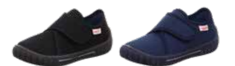
0-808271-0100 SCHWARZ 0-808271-8100 OCEAN KOMBI

Upper: TEXTIL Futter: Textilfutter Sohle: Synthetik Größe: 23-38 Liefertermin: ab sofort WMS mittel