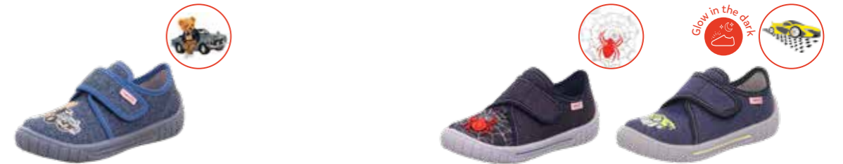
1-000270-8070 BLAU 1-000271-8100 BLAU/ROT 1-800271-8130 BLAU

Upper: TEXTIL Futter: Textilfutter Sohle: Synthetik Größe: 23-38 Liefertermin: ab sofort WMS mittel